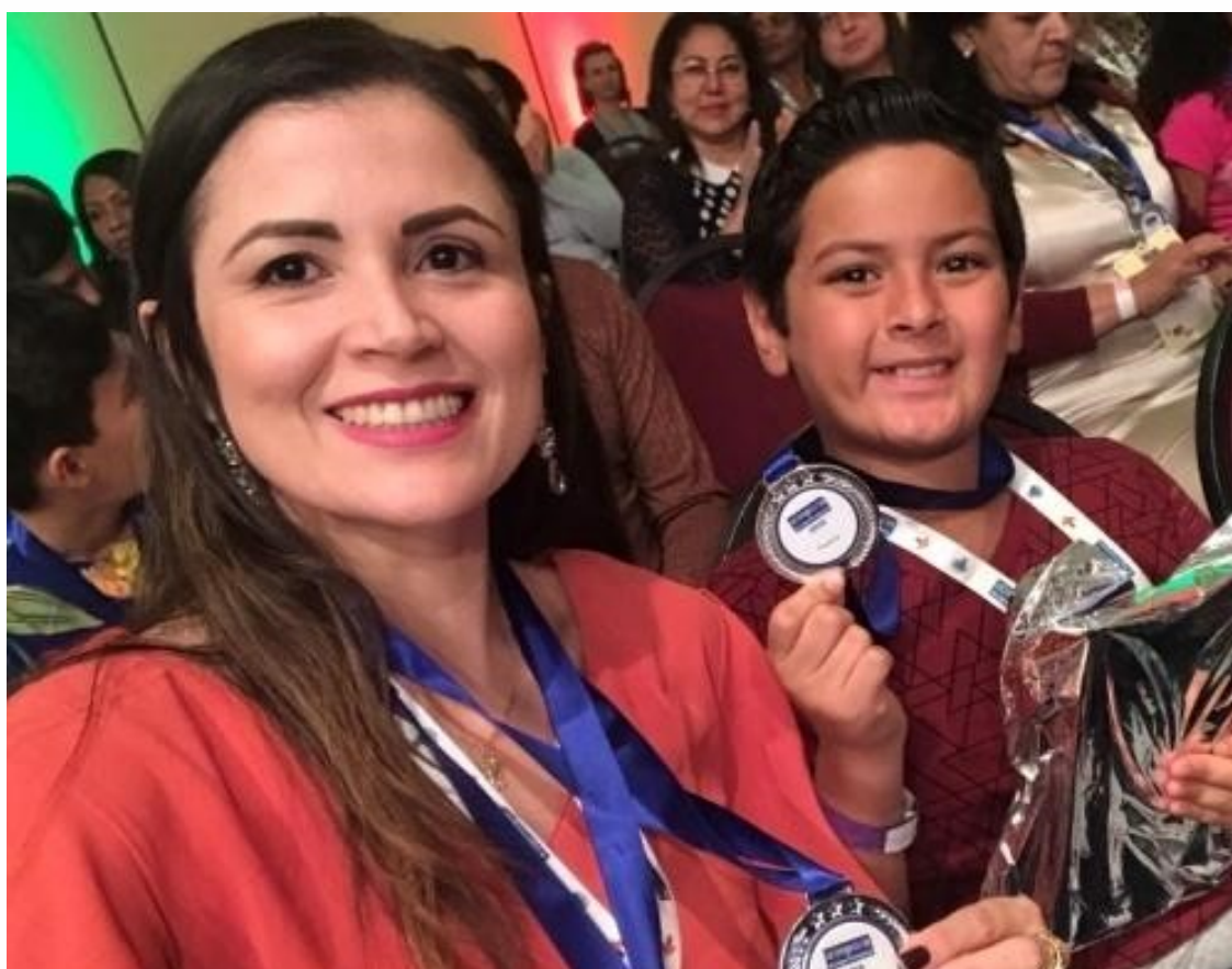
Figura 2 - Semifinalistas e finalistas nas Olimpíadas de Língua Portuguesa, 2019.

Para mim, trabalhar com poemas em sala de aula é um momento de ludicidade e de grande prazer para os atores do processo de ensino e aprendizagem, como bem reforça Souza (2012). A grande recompensa do investimento nesse projeto veio no ano de 2019, durante as Olimpíadas de Língua Portuguesa.