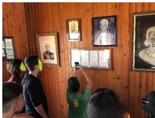
Figura 7 - Estudantes no Parque Histórico Colônia dos Dourados. (MATOS, 2019).

Para o encerramento de toda programação foi disponibilizada uma aula final já na escola para avaliação de todo trabalho, conhecimentos adquiridos, novas experiências ofertadas e socialização com os colegas, que por algum motivo não puderam ir. A avaliação foi extremamente positiva, especialmente quando se volta os olhares para a História como uma disciplina rígida e bruta, de acordo com Nikitiuk (2001, p.48), e que se distancia das demais Ciências Humanas justamente por esse conservadorismo que emerge da própria academia que têm seus cânones hegemônicos eurocentrados, e que na experiência houve a oportunidade de analisar holisticamente para nosso território.