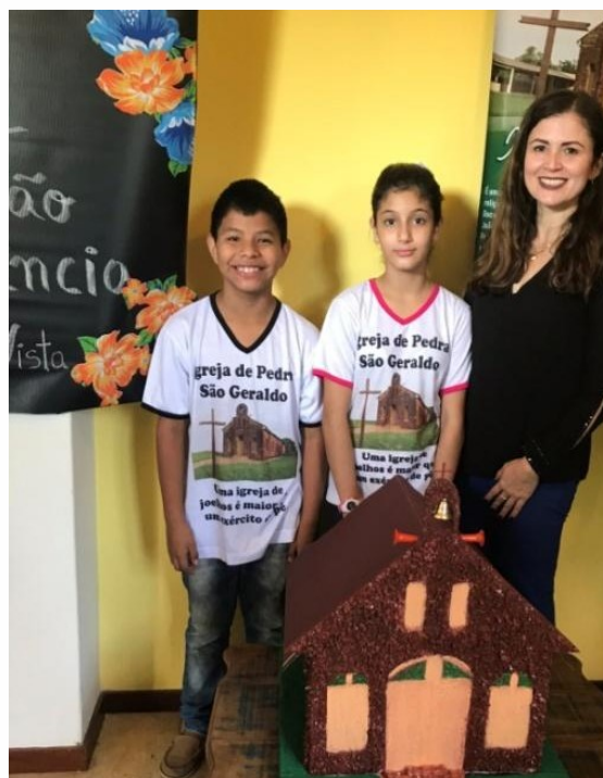
Figura 3 - Grupo de pesquisa em sua apresentação e Maquete da Igreja de Pedra São Geraldo.

Etapa das atividades semanais de contato com a leitura e a produção textual, na disciplina de Língua Portuguesa. Essa parte do processo constituía-se pela escrita dirigida, em caderno de produção textual, no formato dos mais diversos gêneros: lendas, mitos, relato pessoal, crônica, instrução, carta, folheto, contos, biografia, normas/documentos, convites, panfletos e poemas. Cabe destacar que os textos produzidos pelos alunos contavam sempre com duas versões: escrita e reescrita. A etapa fez parte do Projeto durante os meses em que este perdurou e contou com o monitoramento dos acadêmicos do curso de Pedagogia, da Universidade Federal de Mato Grosso do Sul (UFMS), que estiveram sob minha orientação.