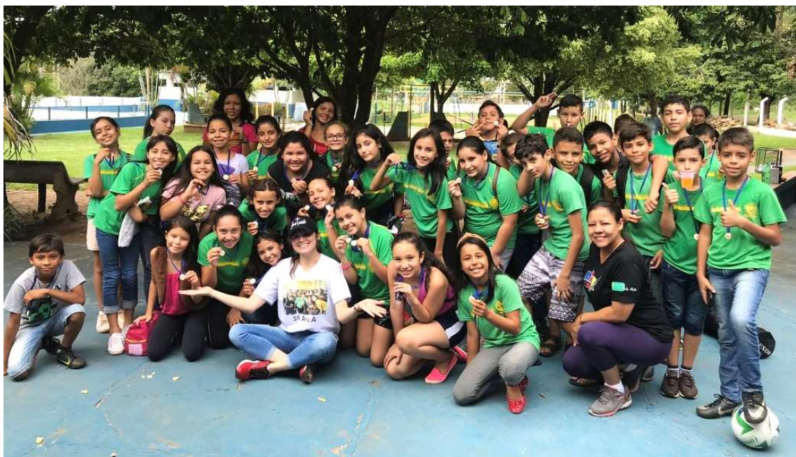
Figura 1 - Turmas A e B, reunidas em passeio externo no dia da culminância do Projeto.

O presente relato sintetiza o processo desenvolvido em turmas do 5º ano do ensino fundamental que resultou em textos escritos em versos. A temática selecionada para os textos é a relação dos alunos com o lugar no qual vivem, isto é, a fronteira entre duas cidades gêmeas: Bela Vista – MS (Brasil) e Bella Vista Norte, no Paraguai. Cabe ressaltar, que uma dessas produções nos levou à final da 6ª edição das Olimpíadas de Língua Portuguesa em São Paulo, iniciativa do Ministério da Educação.