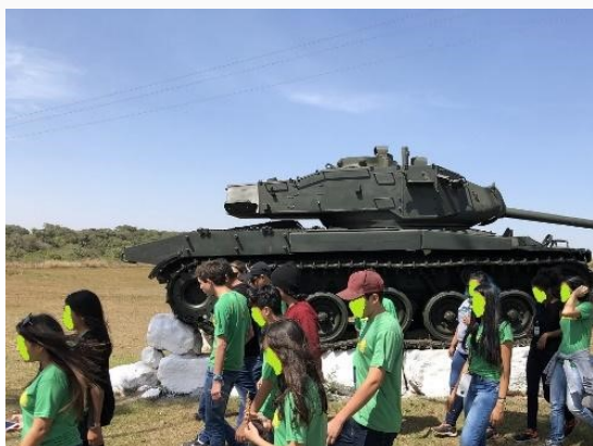
Figura 6 - Estudantes no Parque Histórico Colônia dos Dourados. (MATOS, 2019).