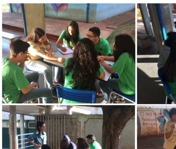
Figura 4 – Discussão da proposta de intervenção

Acontecimentos recentes fizeram parte das conversas entre os grupos, tais como o rompimento das barragens em Mariana e Brumadinho, ambas em Minas Gerais, e o “esquecimento” dessas tragédias pelo poder público e pela mídia. Ao caminhar pelos nichos de estudantes foi observado que os mesmos iam além da proposta inicial, dialogavam sobre intenções, causa, efeito, os prós e os contras à instalação de barragens, bem como discutiam a função dos atores sociais diante do conflito apresentado no filme. Além de tais apontamentos, os estudantes resgataram alguns fatores importantes para a compreensão da totalidade das indagações, temas como a influência do sistema capitalista e a compreensão da relação afetiva entre o indivíduo e o ambiente físico – a topofilia de Tuan (2012).