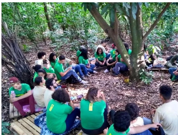
Figura 5 – Discussão da proposta de intervenção

Outro grupo trouxe a possibilidade de trabalhar a fonte do medo que pairava entre a população, apontaram estratégias de fortalecimento da comunidade para resistir às ameaças externas, focando na valorização do seu território como um todo. Uma possibilidade citada pelos estudantes era a intervenção com base na discussão da perda biológica do espaço, pois na circunstância não havia comprovação de aspectos culturais. Ademais, destacaram que o turismo poderia contribuir para a renda do povoado, porém, se posicionaram firmes quanto a não construção da barragem.