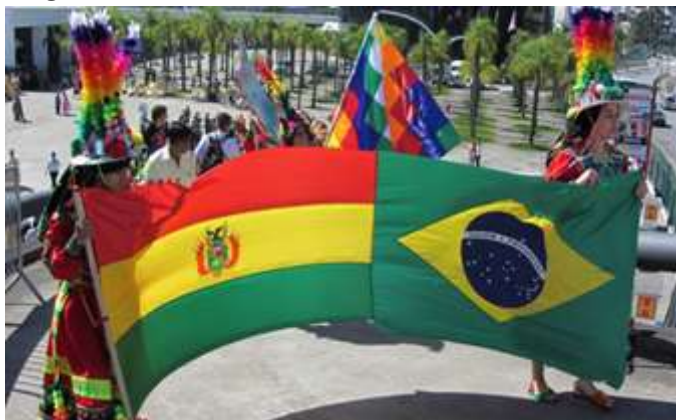
Figura 9 -Festividade Cultural dos povos da fronteira Brasil/Bolívia

O multiculturalismo presente na cidade de Corumbá causa divisões específicas na área de fronteira. A troca cultural e a hibridizem existem, figura 9, mas não significam que as identidades presentes, são aniquiladas, pelo contrário, muitas vezes ressaltam a cultura do 'eu'.